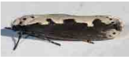
Ethmia bipunctella (Elachistidae)