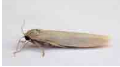
Eilema interpositella (Erebidae)