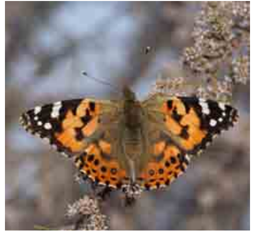
Vanessa cardui (Nymphalidae)