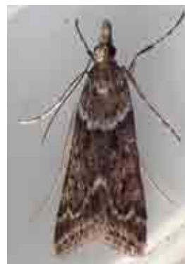
Eudonia angustea (Crambidae)