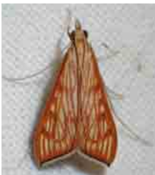
Antigastra catalaunalis (Crambidae)