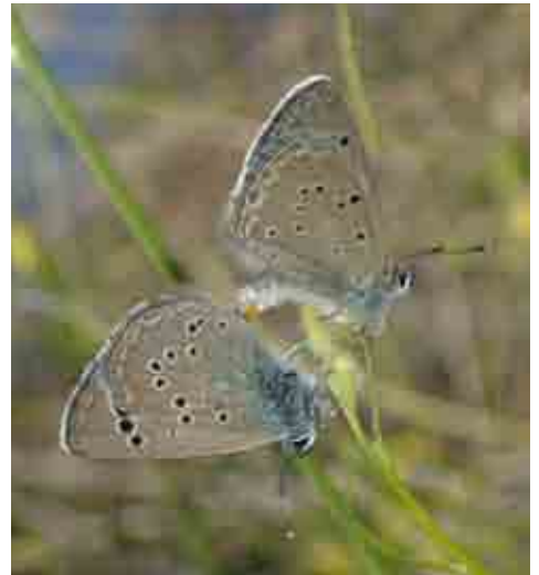
Glaucopsyche melanops (Lycaenidae)