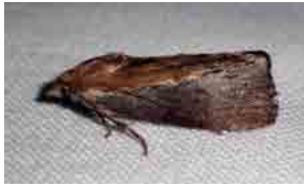
Galleria melonella (Pyralidae)