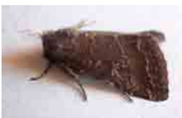
Condica viscosa (Noctuidae)