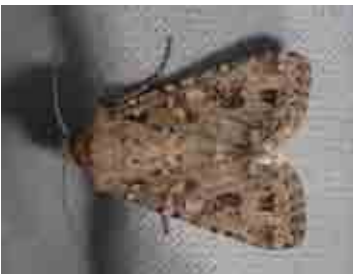
Anarta sodae (Noctuidae)