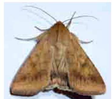
Helicoverpa armigera (Noctuidae)