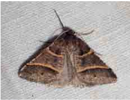
Petrophora convergata (Geometridae)