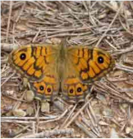
Lasiommata megera (Nymphalidae)