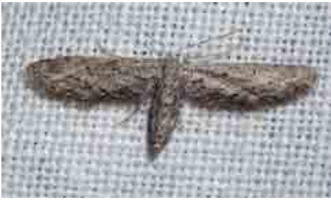
Idaea longaria (Geometridae)