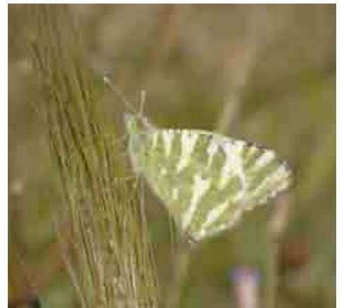
Euchloe belemia (Pieridae)