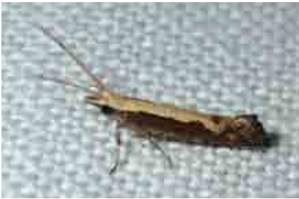
Plutella xylostella (Plutellidae)