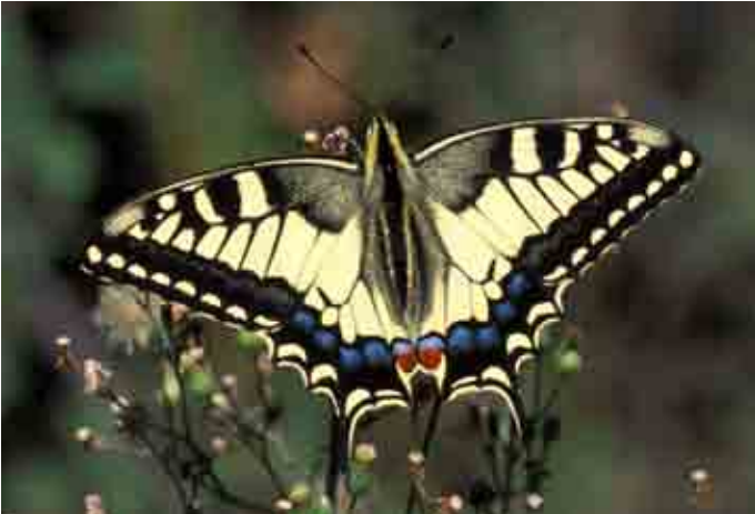
Papilio machaon (Papilionidae)