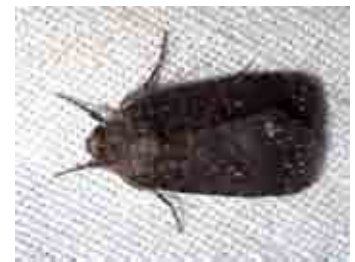
Caradrina germainii (Noctuidae)