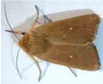
Mythimna sicula (Noctuidae)