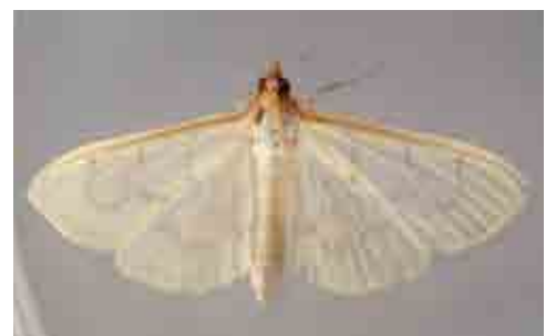
Hodebertia testalis (Crambidae)