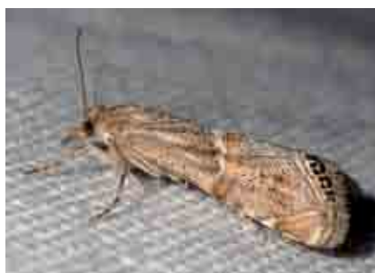
Euchromius cf. ramburiellus (Crambidae)