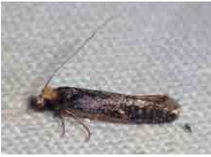
Monopis imella (Tineidae)