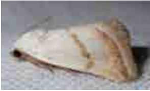
Eublemma pura (Erebidae)