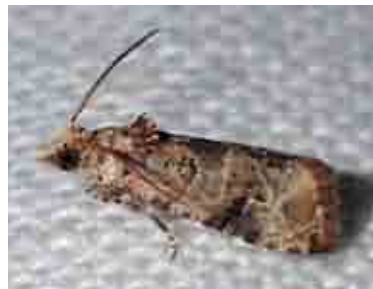
Lobesia botrana (Tortricidae)