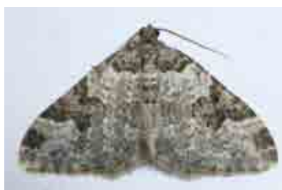
Xanthorhoe fluctuata (Geometridae)