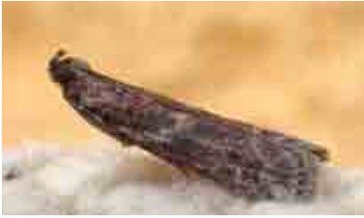
Cryptoblabes gnidiella (Pyralidae)