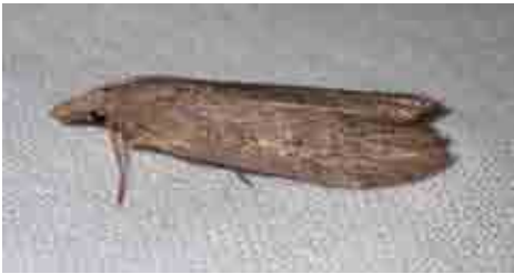
Lamoria anella (Pyralidae)