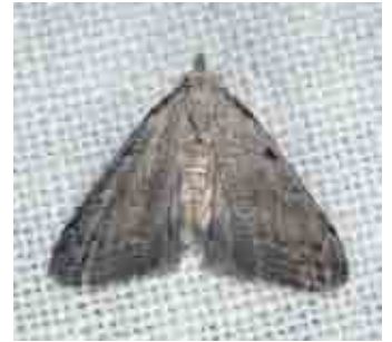
Nola thymula (Nolidae)