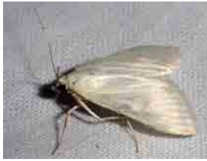
Sitochroa pallealis (Crambidae)