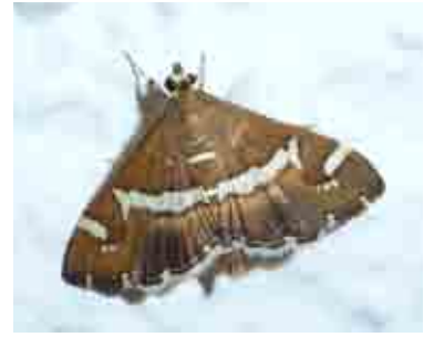
Spoladea recurvalis (Crambidae)