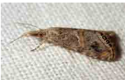
Euchromius cambridgei (Crambidae)