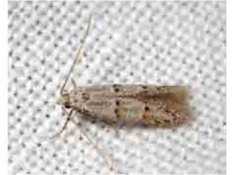
Symmocoides oxybiella (Autostichidae)