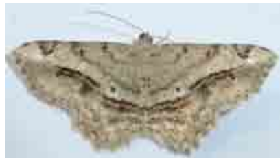
Chiasma aestimaria (Geometridae)