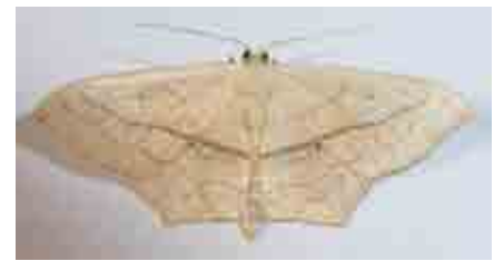
Scopula imitaria (Geometridae)