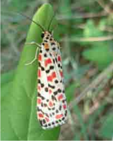
Utetheisa pulchella (Erebidae)