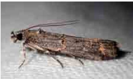
Pempelia cf. brephiella (Pyralidae)