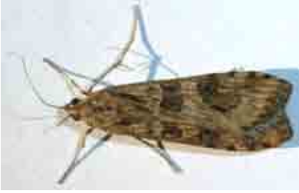
Nomophila noctuella (Crambidae)