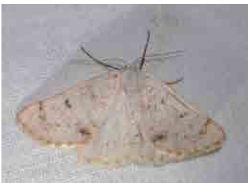
Dyscia penulataria (Geometridae)