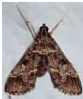
Duponchelia fovealis (Crambidae)