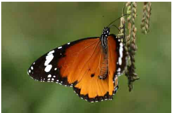
Danaus chrysippus (Nymphalidae)