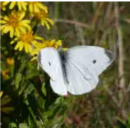
Pieris rapae (Pieridae)