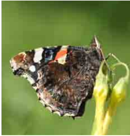
Vanessa atalanta (Nymphalidae)