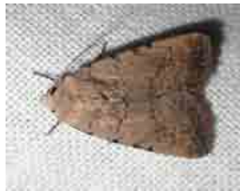
Caradrina clavipalpis (Noctuidae)