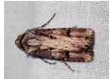
Agrotis catalaunensis (Noctuidae)