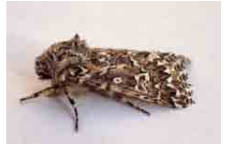
Saragossa seeboldi (Noctuidae)