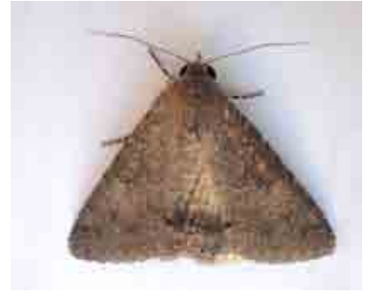
Pandesma robusta (Erebidae)