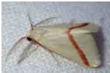
Casilda consecraria (Geometridae)