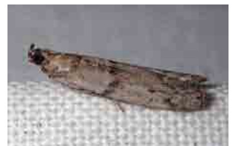
Cadra figulilella (Pyralidae)