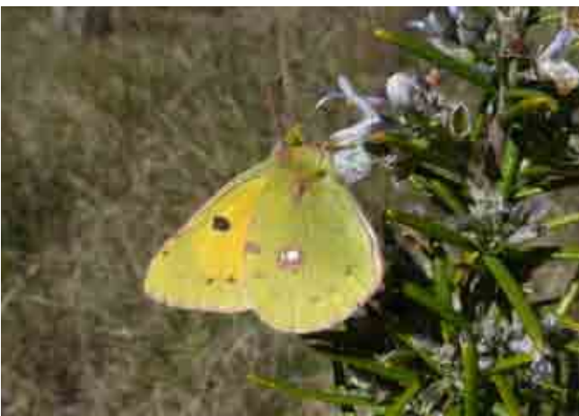
Colias crocea (Pieridae)