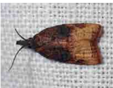
Platynoda stultana (Tortricidae)