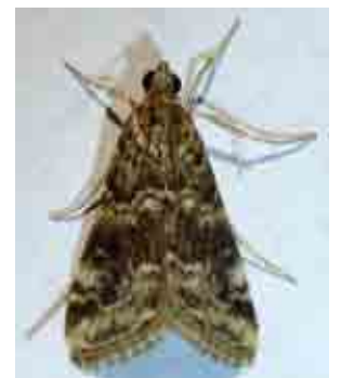
Hellula undalis (Crambidae)