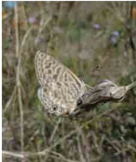
Leptotes pirithous (Lycaenidae)