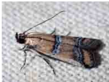
Pseudosyria malacella (Pyralidae)