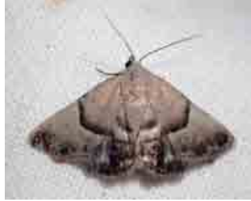
Odice arcuinna (Erebidae)