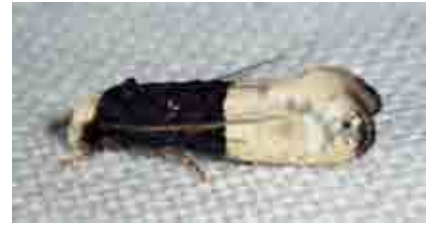
Trichophaga bipartitella (Tineidae)