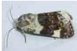
Acontia lucida (Noctuidae)