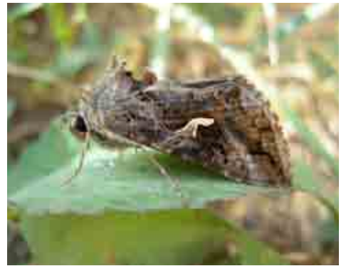
Autographa gamma (Noctuidae)