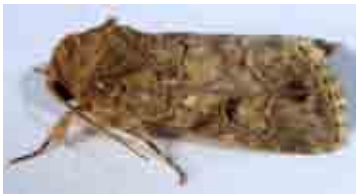
Spodoptera cilium (Noctuidae)