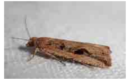
Bactra bacrana (Tortricidae)