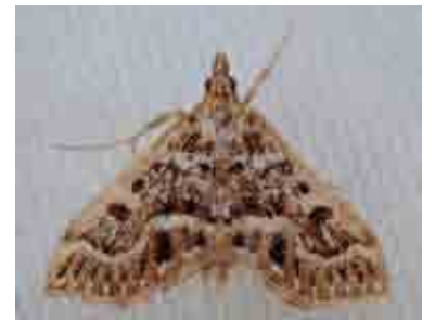
Anania murcialis (Crambidae)