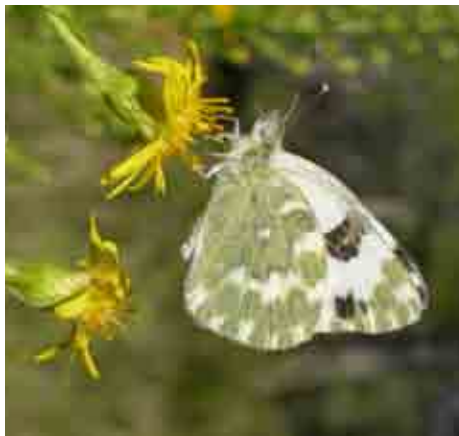
Pontia daplidice (Pieridae)