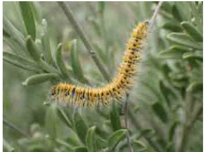
Lasiocampa serrula oruga sobre Anthyllis cytisoides

Dos otras especies fueron citadas del Salar de los Canos por Ylla et al. (2015): Aphomia sabella (Pyralidae) y Eudonia murana (Crambidae)