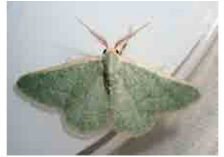
Microloxia cf. herbaria (Geometridae)