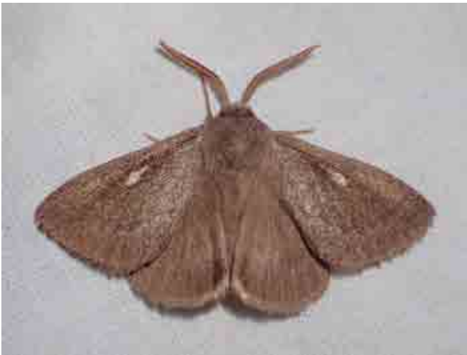
Lasiocampa serrula (Lasiocampidae)