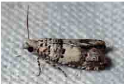
Epinotia thapsiana (Tortricidae)