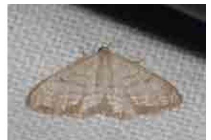
Idaea alicantaria (Geometridae)