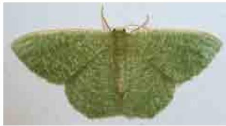
Phaiogramma faustinata (Geometridae)