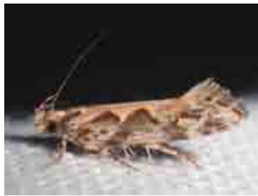
Ornativelva cf. antipyramis (Gelechiidae)