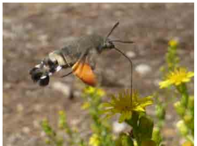
Macroglossum stellatarum (Sphingidae)