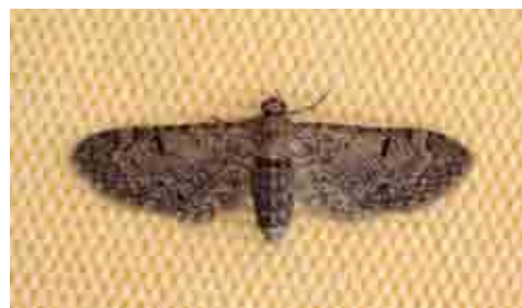
Eupithecia ultimaria (Geometridae)