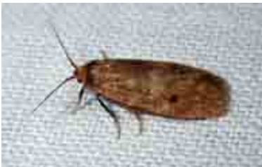
Pelosia plumosa (Erebidae)