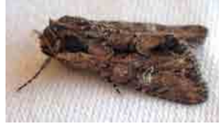
Mniotype occidentalis (Noctuidae)