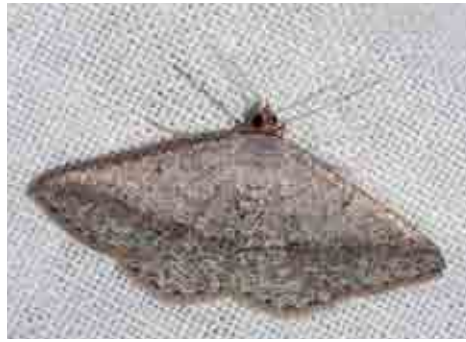
Isturgia catalaunaria (Geometridae)