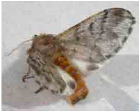
Thaumetopoea pityocampa (Notodontidae)