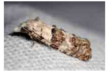
Phtheochroa syrtana (Tortricidae)