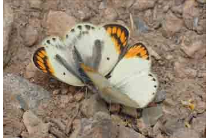
Colotis evagore (Pieridae)