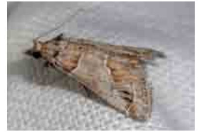
Hypotia infulalis (Pyralidae)