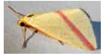
Rhodometra sacraria (Geometridae)