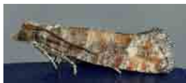
Rhyacionia pinivorana (Tortricidae)