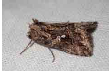
Trichoplusia ni (Noctuidae)