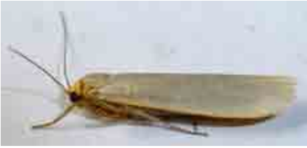
Eilema caniola (Erebidae)