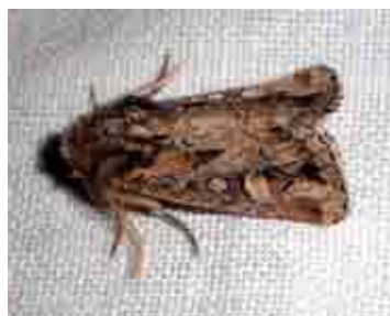
Eremopola orana (Noctuidae) vulnerable