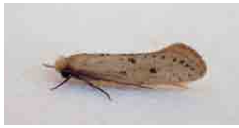
Myrmecozela ataxella (Tineidae)