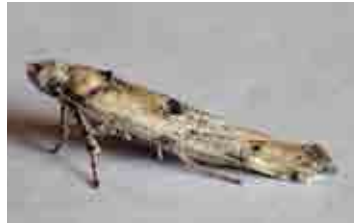
Zelleria oleastrella (Yponomeutidae)