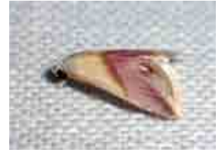
Eublemma cochylioides (Erebidae)