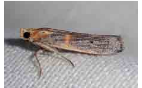
Oxybia transversella (Pyralidae)