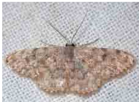
Scopula asellaria (Geometridae)