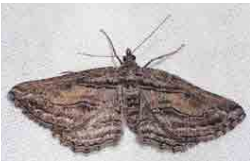
Sardocynria fortunaria (Geometridae)