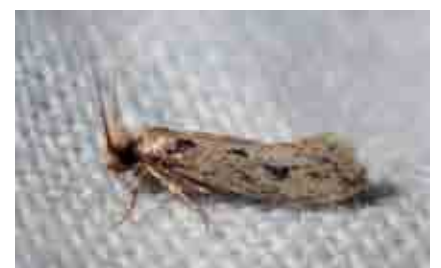
Anomalotinea liguriella (Tineidae)