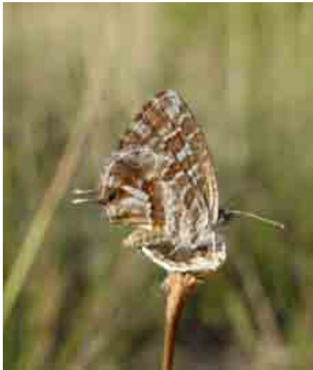
Cacyreus marshalli (Lycaenidae)