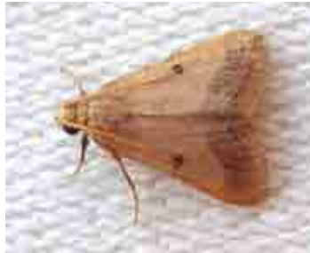
Maradana fuscolimbalis (Pyralidae)