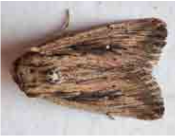
Leucania putrescens (Noctuidae)