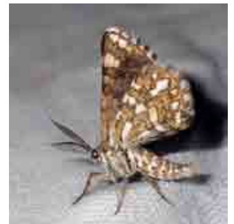
Cinglis andalusiaria (Geometridae)