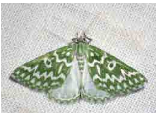
Thetidia plusiaria (Geometridae)