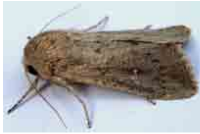
Leucania zae (Noctuidae)