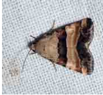
Pseudozarba bitartita (Noctuidae)